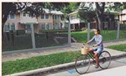
fizikalna definicija sistema ograde