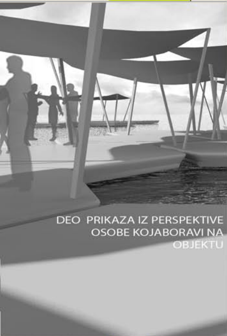
DEO PRIKAZA IZ PERSPEKTIVE OSOBE KOJABORAVI NA OBJEKTU

ronioci-Istrazivaci borave na prostoru jezera viktorija tokom perioda od dva meseca, tokom kog istrazuju zivi svet jezera. /buduci da je jezero veliko, a istrazivanje se vrši daleko od jezerske obale, oni su primorani na neprekidan boravak na tom prostoru.