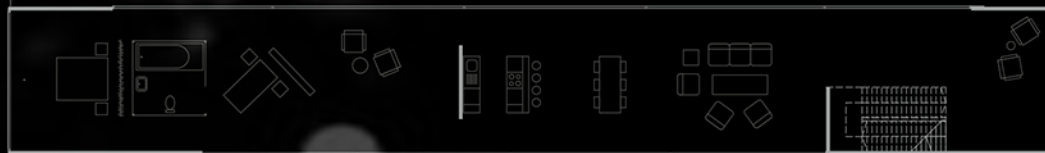
osnova na koti +5.50