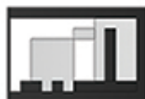
попречни пресек 1