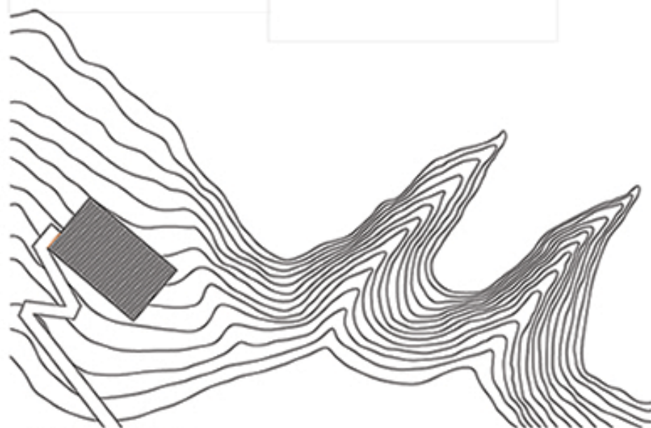
ситуациони план објекта