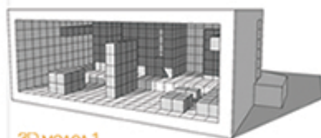
3D модел 1