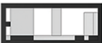
подужни пресек 2