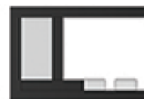
попречни пресек 2