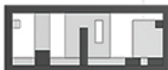
подужни пресек 1