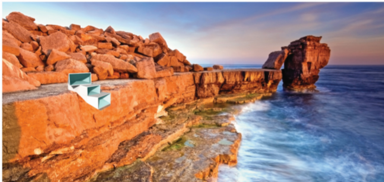
Prilozak 22 model stambene jedinice sa terasom