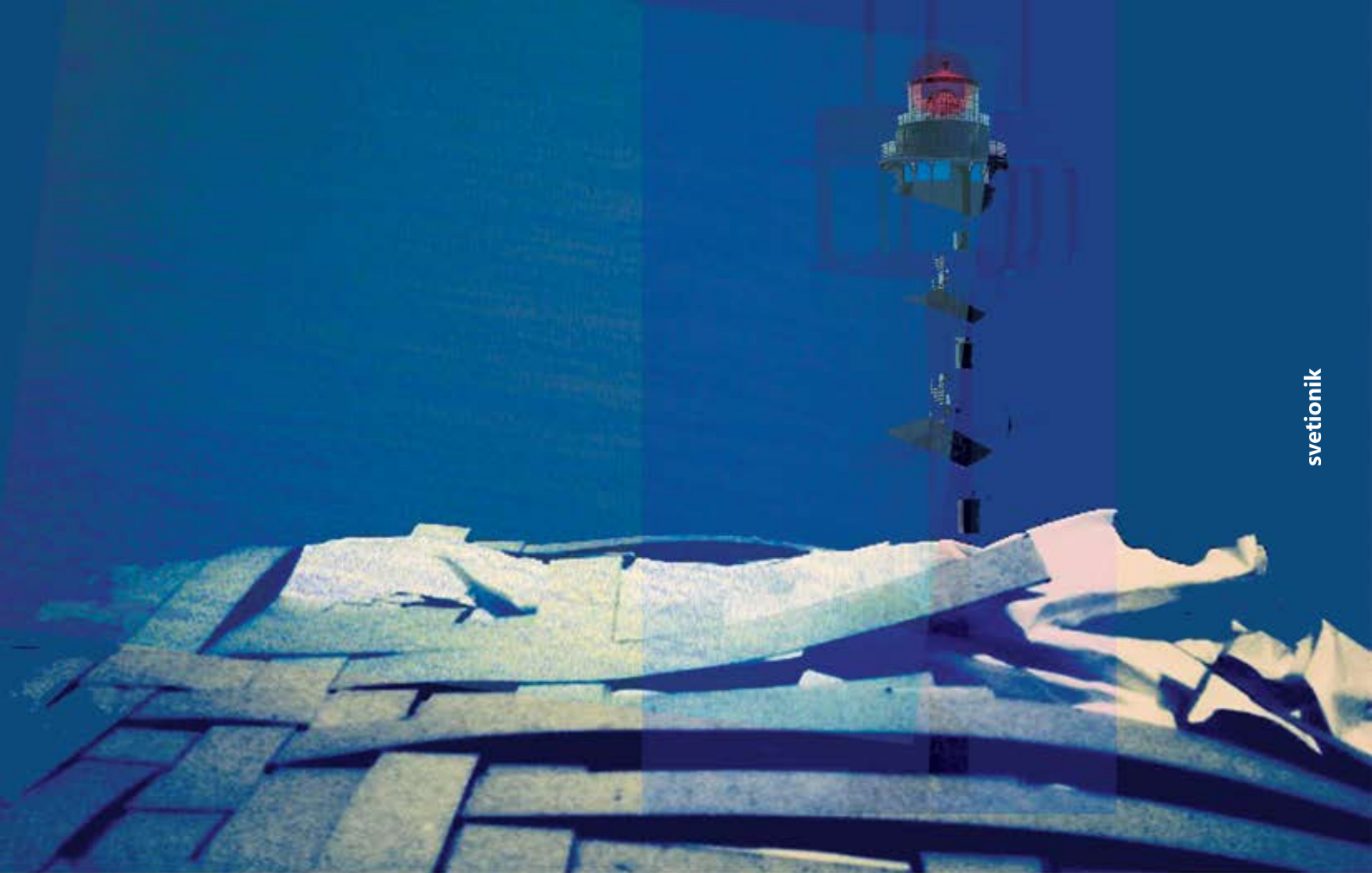
fotomontaža / idejna skica / fotografija svetionika