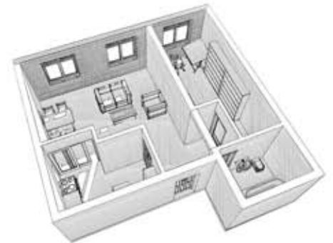
IZMENJENA OSNOVA R=1:100