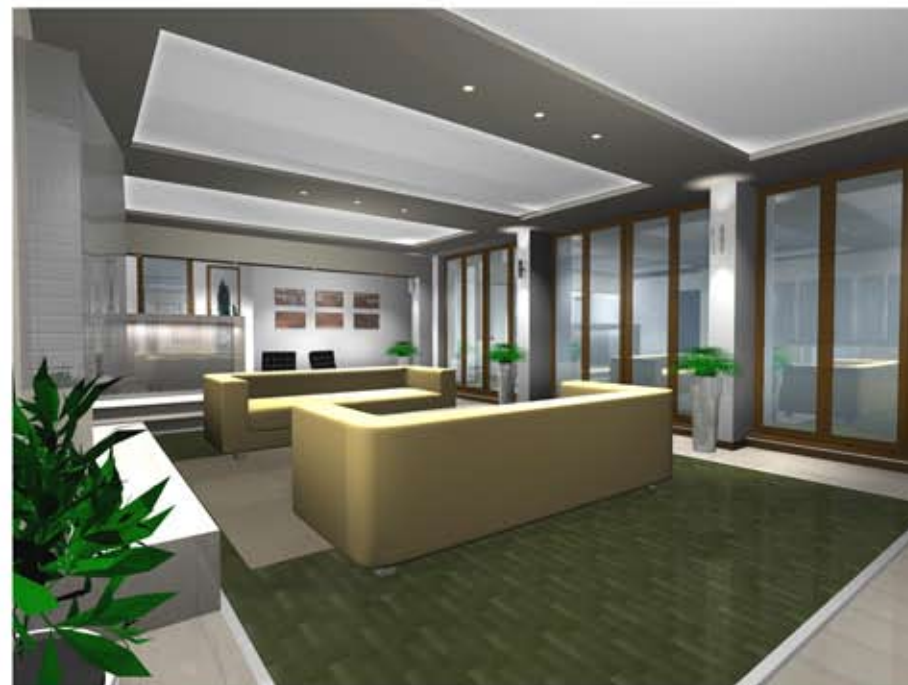
3d - render idejnog resenja dnevne sobe