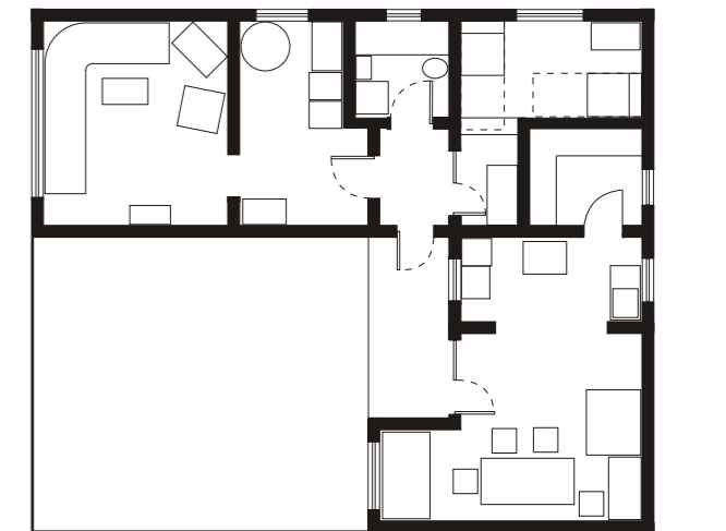
POSTOJEĆE STANJE R 1:200