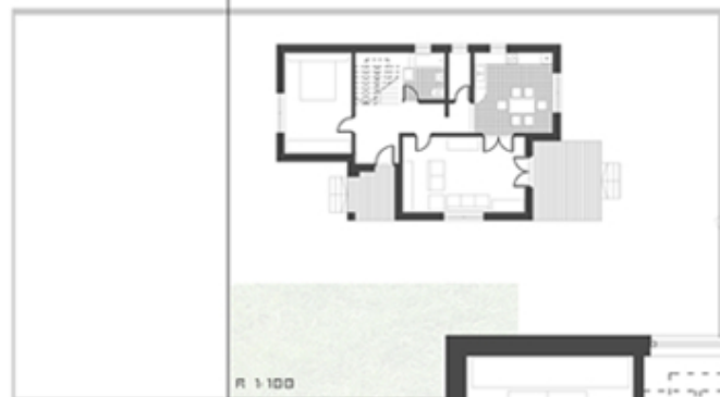
R 1:100 osnova prizemlja