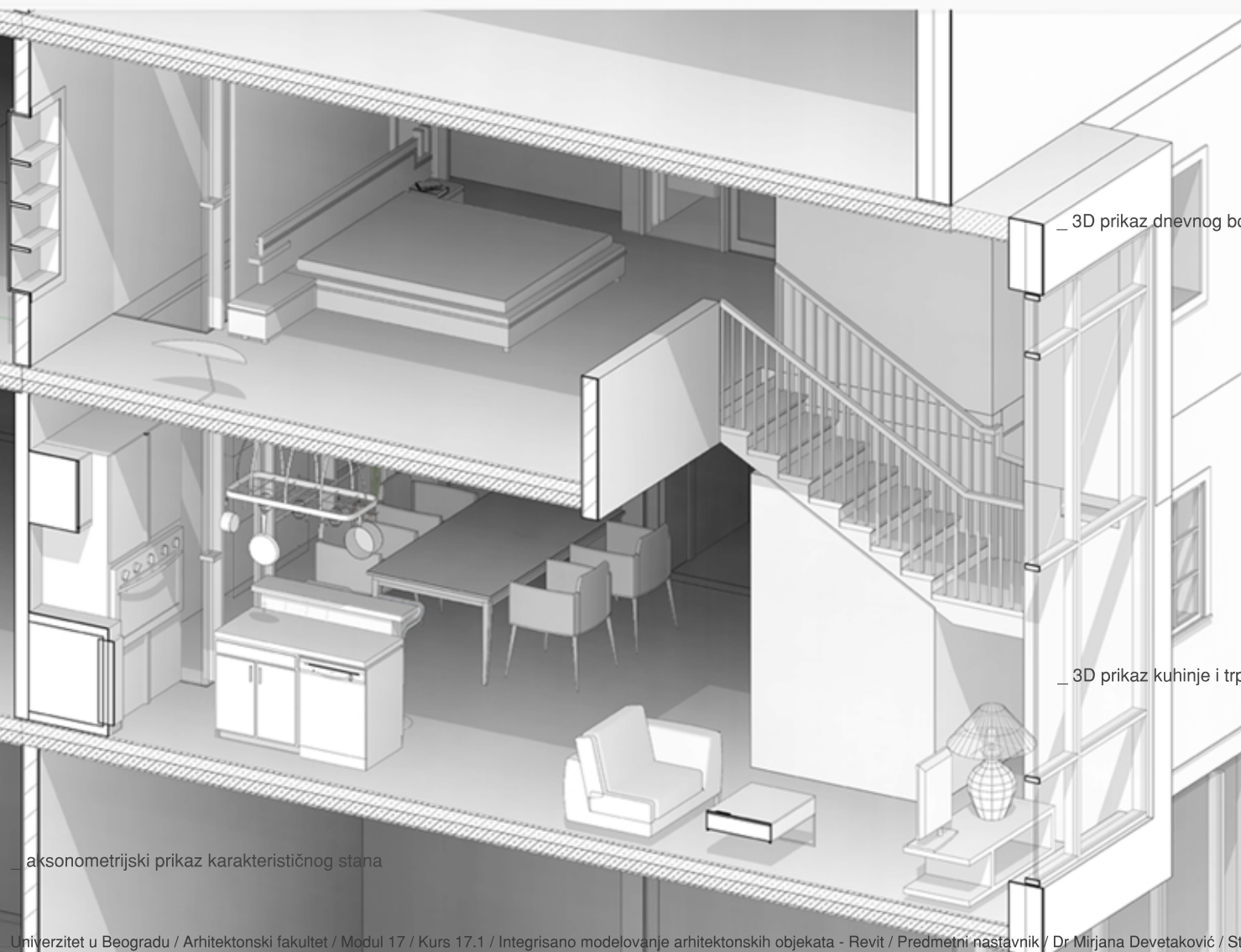
_ aksonometrijski prikaz karakterističnog stana