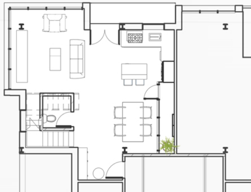
_ osnova prve etaže karakterističnog stana