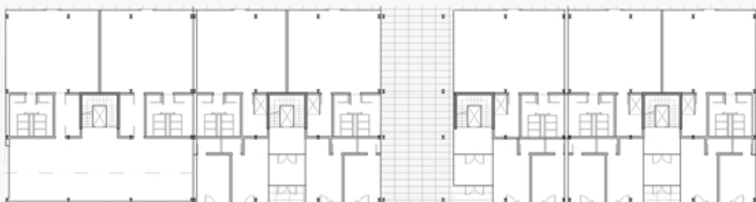
_ osnova partera stambenog bloka