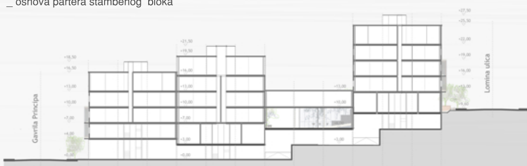
_ podužni presek stambenog bloka