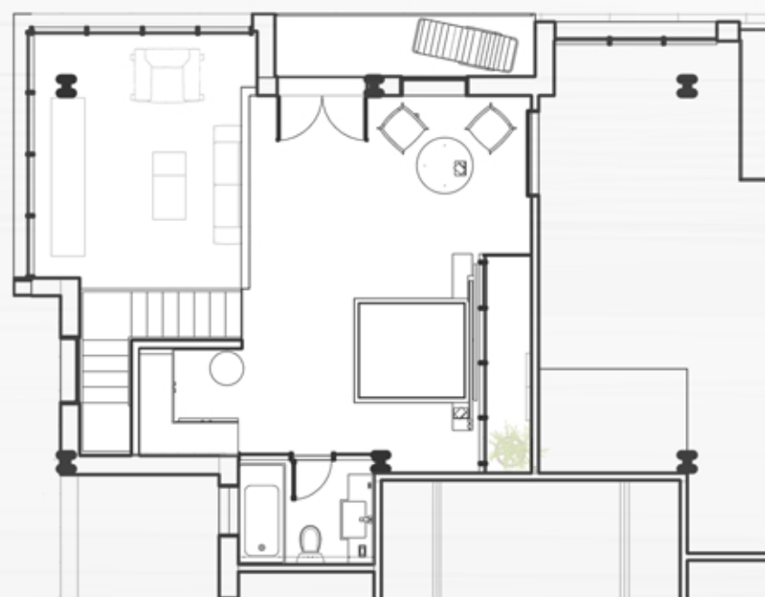
_ osnova druge etaže karakterističnog stana