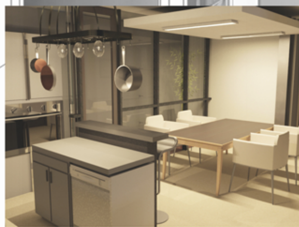
_ 3D prikaz kuhinje i trezanje