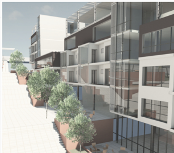
_ 3D prikaz stambenog bloka