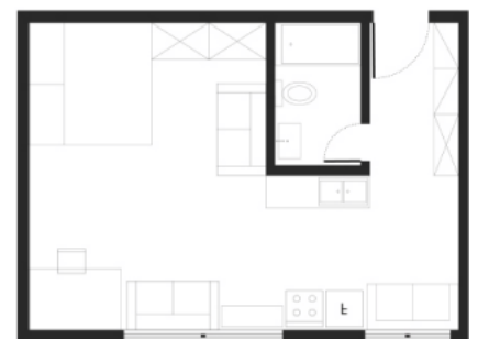
sl.1 postojeći raspored sl.2 arhitektonski predlog novog razmeštaja nameštaja