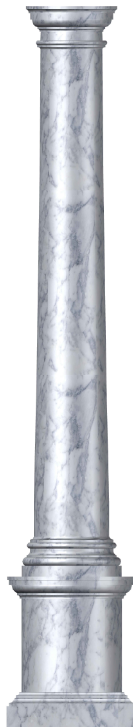
■ Realistični prikaz