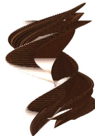
Sl. 3 - Right