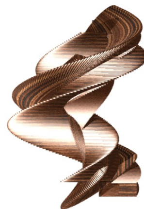
Sl. 2 - Front