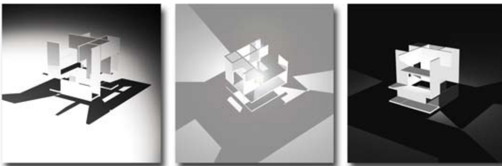
Slika 1.01 Prva tri modela predstavljaju varijacije sa 7, 11 i 20 kubicnih elemenata dimenzija a=2 b=5 c=1 . Prikazi su dobijeni varijacijama Spot, Linear i Pointlight opcije.